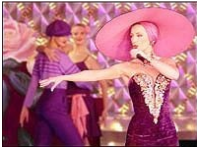
la vie en rose